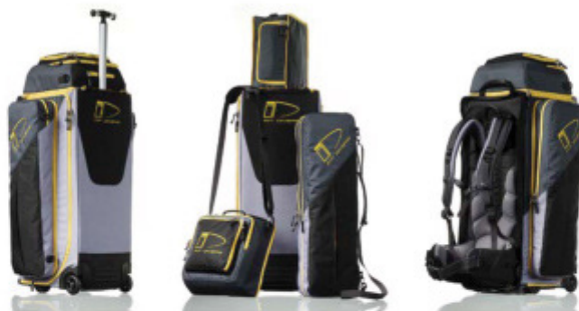
Détails du système de sacs Multitravel d' International Divers

Ce système de sacs de plongée modulaire permet de s'adapter à vos besoins personnels.